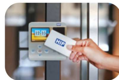
Time Attendance Card