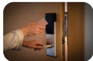
Access Control Card